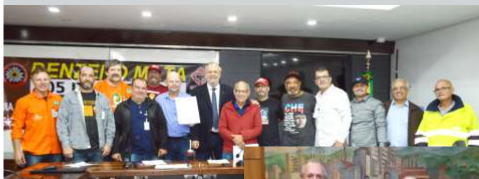
Coletivo de Sindicatos entregaram Carta pelo retorno da CNPBz e CEBz que os parlamentares levaram ao Ministro do Trabalho

Os Sindicatos alertaram para a gravidade que representa esta interrupção dos trabalhos sistemáticos desta Comissão no acompanhamento do cumprimento do Acordo Nacional do Benzeno (que é Lei) com suas orientações de boas práticas, principalmente nas reuniões e nas visitas às empresas, sempre com caráter orientativo que possibilitavam uma atuação em linha que iniciava com a Comissão Nacional (CNPBz), passava pelas Comissões Estaduais (CEBz), chegando aos Grupo de Trabalho do Benzeno (GTB) de cada CIPA nas empresas, implementando na prática as medidas de PREVENÇÃO à exposição a este produto cancerígeno.